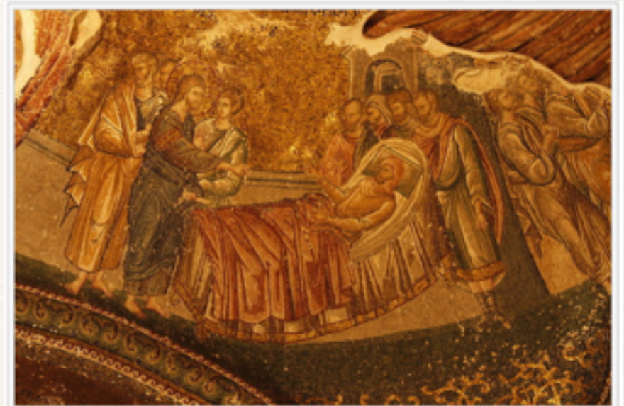
Jesus curando o paralítico em Cafarnaum Mosaico no nártex externo da Igreja de Chora, em Istambul.

Jesus precisou apenas verbalizar o comando.