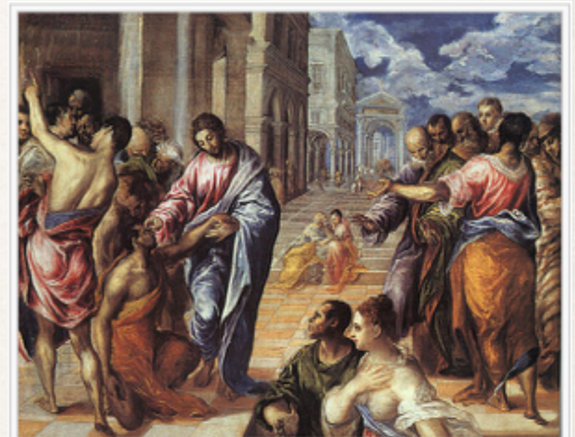
Jesus curando o cego.

Jesus necessitou de uma ação local e outra no ser como um todo e, depois, repetiu o procedimento.