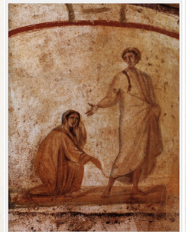
Jesus curando a mulher com sangramento Afresco na Catacumba de Marcelino e Pedro, em Roma.

Jesus não pode ter “impregnado” o fluido com qualidades específicas, pelo simples fato de ele não saber quem o tocou.